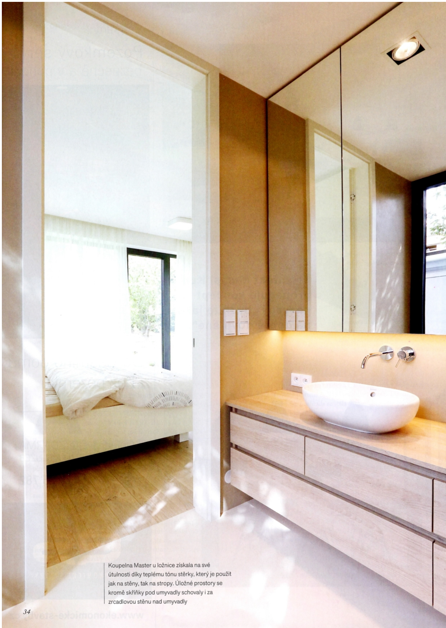
Koupelna Master u ložnice získala na své útulnosti díky teplému tónu stěrky, který je použit jak na stěny, tak na stropy. Úložné prostory se kromě skříňky pod umyvadly schovaly i za zrcadlovou stěnu nad umyvadly